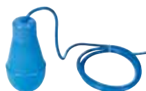
IFB Régulateur de niveau